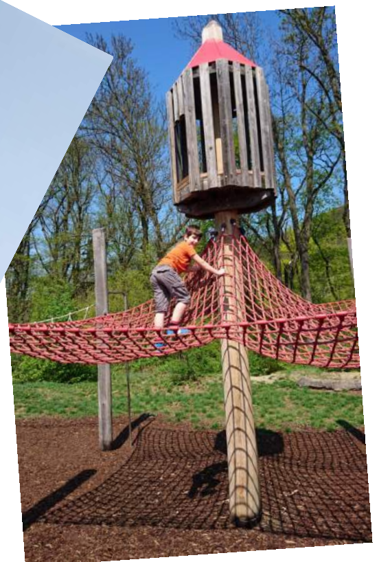
Liebe, frühlingshafte Grüße, die Linden