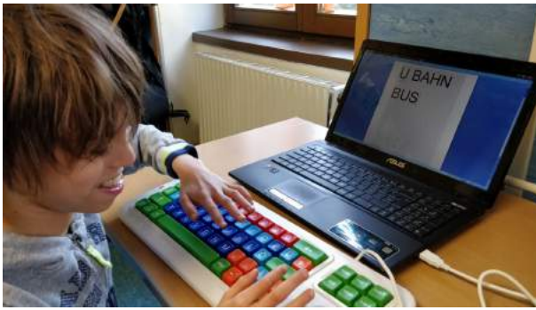
Auch Sebastian versucht sich!