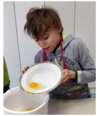
Muffins mit Kakao oder Birnenstücken