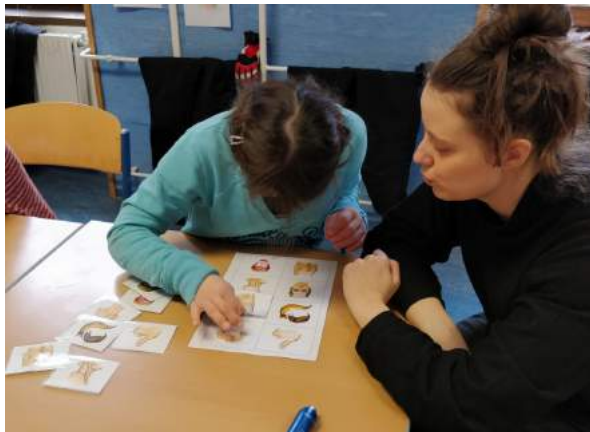
In der Lernzeit gibt es viel zu tun...